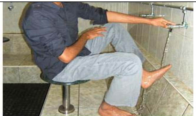
✗ روش غلط