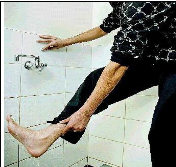
✗ روش غلط

روش غلط (۱): افراد در تصاویر زیر آب را روی پای خویش می ریزند. آنها پای خویش را مسح نمی کنند. این طریق وضو بین اکثریت اهل سنت متداول است و روش غلطی است.